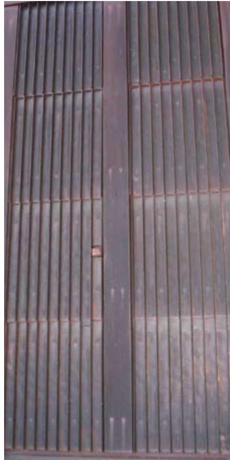
Verdeckt: Die Verrohrung hinter den kupfernen Wandelementen ist von außen nicht zu sehen