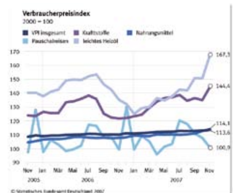
Preisexplosion: Die Preisentwicklung für Heizkosten ist gigantisch

Wärmetauscher, Wärmepumpe und alternative Kollektorsysteme sind geradezu prädestiniert, um in Verbindung