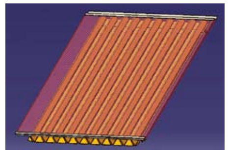
Denkbar: Kombination mit einem Photovoltaikkollektor