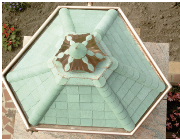
Bild 5.: Aus der Vogelperspektive wird die Liebe zum Detail ebenso deutlich erkennbar ...

△ Bild 4.: Rückansicht des Kamingrills. Die vorgehängte Rinne wird über einen selbst gefertigten Wasserspeicher entwässert.