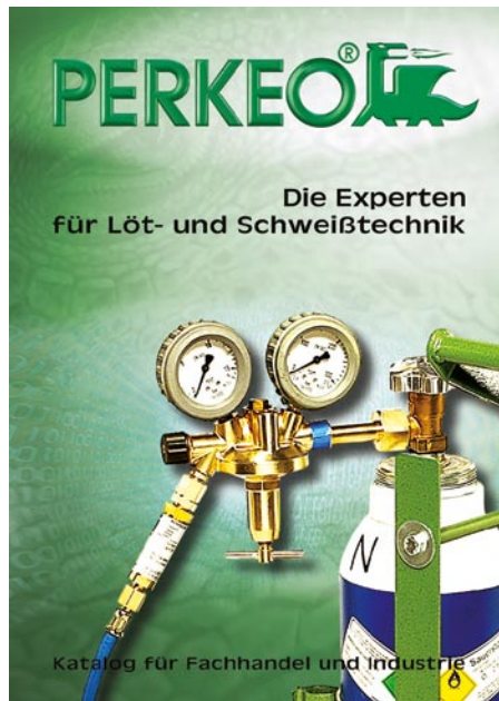
Der aktuelle Gesamtkatalog ist kostenlos zu haben.

Der Vertrieb erfolgt direkt an die Industrie und über den Fachhandel. Die Praxispartner der Perkeo-Produkte sind Klempner, Dachdecker, Sanitär- und Heizungsinstallateure, Klimabauer, Spezialisten von metallverarbeitenden Betrieben aus Handwerk und Industrie sowie aus dem Hoch-, Tief- und Straßenbau, von Feuerwehren und vom Technischen Hilfswerk. Ebenso arbeiten Goldschmiede, Dental-Labors, Instrumentenbauer und Glasbläser mit Perkeo-Brennern. Jeder Interessent kann den aktuellen Gesamtkatalog per Telefon 0 71 50/ 35 04 30 kostenlos anfordern.