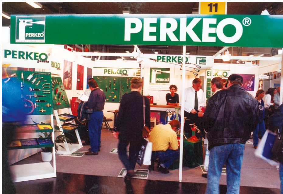
Auf Fachmessen treffen die Perkeo-Mitarbeiter gerne ihre Endkunden.