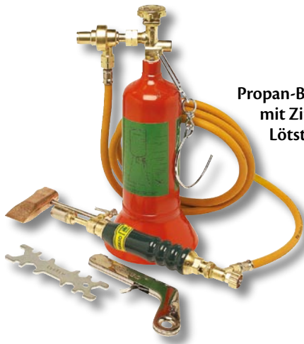
Propan-Brenner mit Zinnlux-Lötstück.