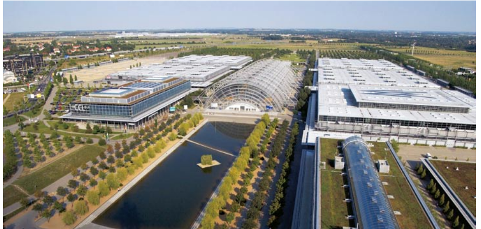
Luftbildaufnahme des Leipziger Messegeländes.

Ein Überblick über die Aussteller, die aus unserer Branche auf der Dach + Wand in Leipzig Flagge zeigen werden, folgt in Heft 3/2005. Wir hoffen, dass es viele sind. Sonst können wir auch zu Hause bleiben. Das wäre uns aber ganz und gar nicht recht, denn eigentlich freuen wir uns auf das schöne Leipziger Messegelände mit seiner Übersichtlichkeit und Mo-