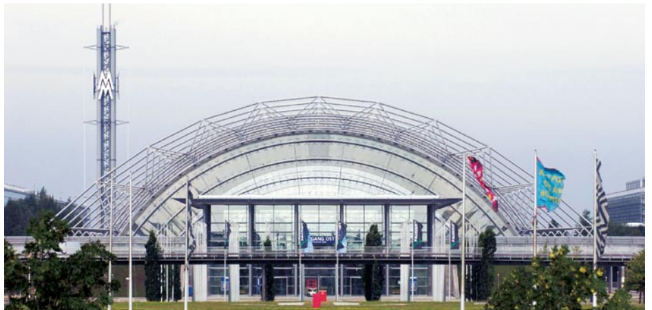
Die zentrale Glashalle mit 80 m Spannweite, 30 m Scheitelhöhe und einer Länge von 243 m gilt als neues architektonisches Wahrzeichen Leipzigs.

dernität. Und noch mehr freuen wir uns auf das Wiedersehen mit unseren Lesern aus dem Klempnerhandwerk, Handel und Industrie, von denen wir viele schon lange, lange kennen. Und wir haben noch einen Anlass, uns auf diese Messe zu freuen. Denn dort, in Leipzig, wollen wir das 20-jährige Jubiläum von BAUMETALL feiern. Unser Verlag hat jedenfalls schon einen Ausstellungsstand gebucht. Klein, aber fein. Wir hoffen, Sie dort wieder zu sehen. Oder kennen zu lernen.