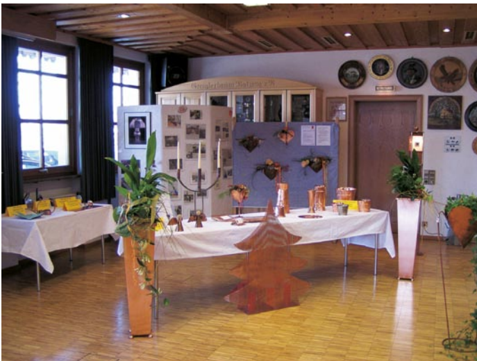
Blick in die von Norbert Heinzlmeier gestaltete „Spengler-Kunst-Ausstellung“. Im Bildvordergrund der kupferne Christbaum aus Lochblech, links und rechts Blumensäulen.