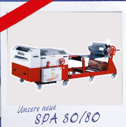
Unsere neue SPA 30/80