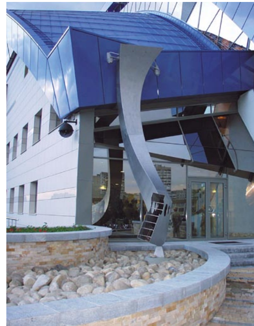
Merkwürdig verdrehte, überdimensionierte Fallrohre aus Edelstahl entwässern das Aluminiumdach in Azurblau-metallic.

Für das blaue Falzdach des „Olimp“ genau das richtige Material, findet Architekt Yuri Serjogin. Die futuristische Sportarena besitzt nun einerseits ein aufregendes Design – die ineinander geschobenen Tonnen leuchten schon von weitem, dennoch ist der Bau solide und bautechnisch perfekt ausgeführt. So wundert es eigentlich nicht, dass die Halle mit dem Schildkrötenpanzer für die sportbegeisterte Bevölkerung Yuzhniys längst zum Wahrzeichen geworden ist.