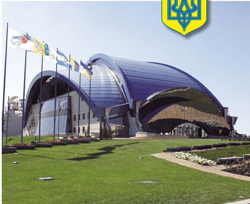
Außerirdisch wirkende Architektur: Die neue Mehrzwecksporthalle in Yuzhnyi, einem Vorort von Odessa, ähnelt einer riesigen Schildkröte mit leuchtend blauem Panzer.

Odessa, die „Perle am Schwarzen Meer“, ist bereits seit gut 200 Jahren eine welt-offene, lebendige Stadt zwischen Orient und Okzident. Nachdem Russland das Küstengebiet um den osmanischen Handelsplatz Hadschibej erobert hatte, erließ Zarin Katharina II. im Jahr 1794 den Befehl, den strategisch günstig gelegenen Ort zu einer schlagkräftigen Hafenstadt auszubauen. Schnell entwickelte sich das junge Odessa zu einem internationalen Handelszentrum. Anfang des 19. Jahrhunderts setzte sich der französische Bürgermeister Odessas, Armand Emmanuel du Plessis, Herzog von Richelieu, aktiv dafür ein, das Stadtbild auf internationales Niveau anzuheben. An der Gestaltung der planmäßig angelegten Stadt wurden namhafte europäische Architekten beteiligt. Ein buntes Völkergemisch aus Russen, Juden, Ukrainern, Griechen, Deutschen, Franzosen, Rumänen, Arabern, Türken, Armeniern, Georgiern und viele anderen Nationalitäten trug stark zur kulturellen und wirtschaftlichen Entfaltung der Stadt bei. Die Metropole am Meer mit der südländisch ungezwungenen Atmosphäre lockte Künstler und Adlige, Bürger und Bohemiens. Viele verbrach-