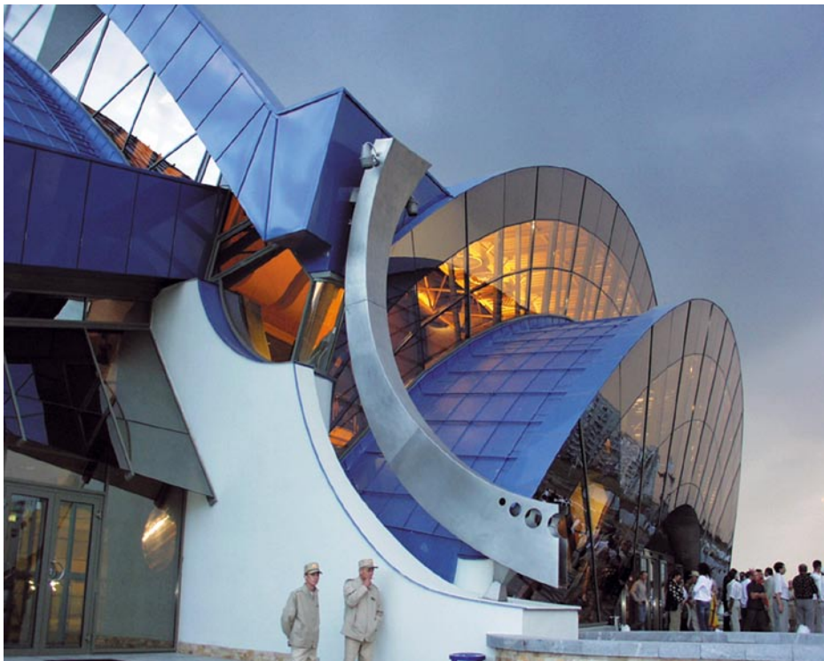
Zu den Sportveranstaltungen strömen die Bewohner von Yuzhnyy in hellen Scharen. Für sie ist ihr futuristisches Sportzentrum das neue Wahrzeichen der Stadt.

ternehmer Santa den Zuschlag an deutsche Auftragnehmer: von der Innen- und Außenbeleuchtung über die Lieferung von Heizkesseln bis hin zur Klimatechnik. Das Metaldach beispielsweise stammt komplett aus deutscher Hand. Die Ausführung der blauen Aluminiumtonnen, der Edelstahl-Regenfallrohre sowie der stücklackierten Aluminiumfassadenbleche lag bei der Firma Böhme aus Boxberg bei Dresden. Die bandlackierte Dachhaut aus Falzonal in Stehfalzqualität lieferte das Novelis Werk in Göttingen. In einem innovativen Verfahren hatte die Dr. Mirtsch GmbH in Teltow das Material zuvor wölbstrukturiert. Rund 6000 m 2 Warmdach mit einer Unterkonstruktion aus Profiltafeln und Foamglas als Wärmedämmung montierten Böhme Mitarbeiter im ukrainischen Yuzhnyy. Zwei verantwortliche Chefmonteure von Böhme waren sechs Wochen vor Ort, überwachten die Montagearbeiten und lernten dabei einheimische Kräfte an.