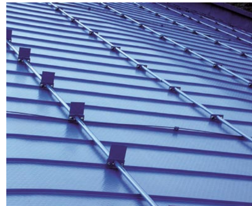
Die Wabenstruktur der Falzonal-Dachhaut entsteht durch ein spezielles Verfahren, das sich Erkenntnisse der Bionik zunutze macht.