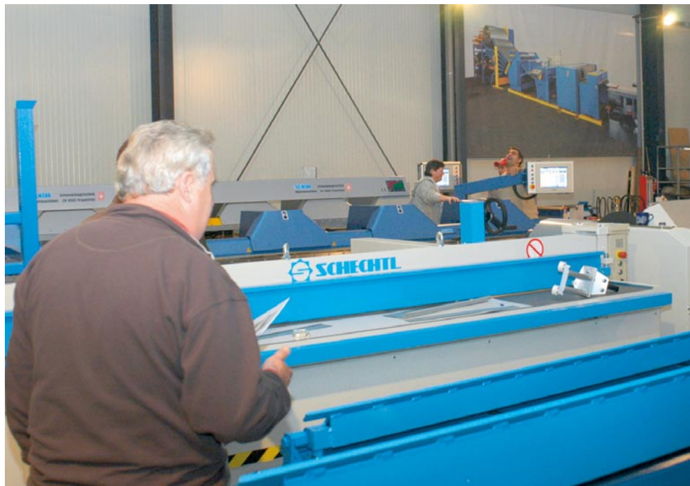
Die Halle ist (noch) voll: Offenbar waren 2006 viele Bauhandwerker gut im Geschäft, und so mancher Klempner gönnte sich zum Jahresende noch eine neue oder gebrauchte Maschine.