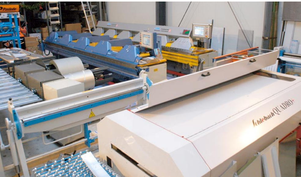
Auch in der Ausstellungshalle – hier eine Schlebach Quadro+ im Vordergrund – kann man so viele verschiedene Metallbearbeitungsmaschinen nur selten direkt nebeneinander erleben.