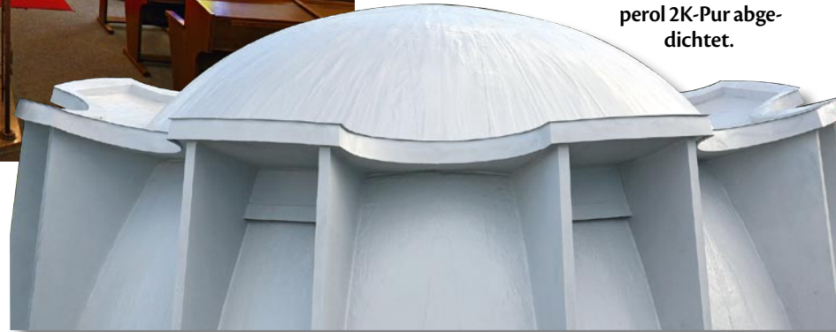
Blick in das Innere der Synagoge.

▼ Das Kuppeldach der Synagoge wurde mit dem lösemittelfreien Kemperol 2K-Pur abgedichtet.